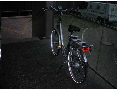
E-Fahrräder, E-Roller (Fa. adissa)