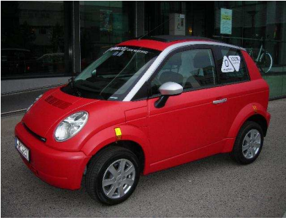
Thlink – Klaus Nemeth, Fa. Denzel: PKW 2 Sitzer ca. bis max. 40kW