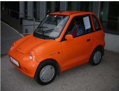
Reva – Fa. Comtex green – Klein-PKW 2 Sitzer + 2 Kinder, 6kW – kurzfristig bis 13kW, ab Herbst auch als 4-Sitzer